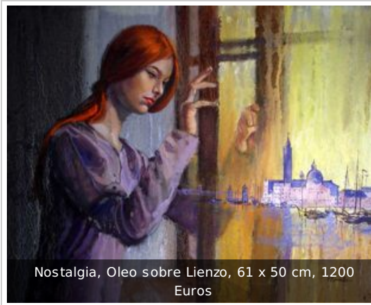
Nostalgia, Oleo sobre Lienzo, 61 x 50 cm, 1200 Euros